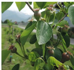
Pero, William's BC , Cadenazzo, 05.05 Stadio I, allegazione dei frutti