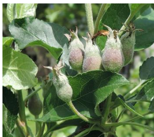
Melo, Galaxy , Cadenazzo, 05.05 Stadio I, allegazione dei frutti