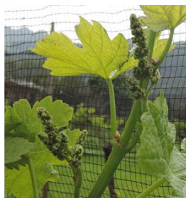
Uva Merlot Gudo , 05.05 Stadio BBCH53, grappoli visibili