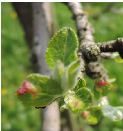
Melo, Galaxy, 07.04 Attacco precoce di afide galle-rosse

Gli afidi infestano la pagina inferiore della foglia e questa specie particolare ( Disaphis devecta ), con la sua attività primaverile causa la formazione di una pseudogalla, dovuta alla modificazione dei tessuti fogliari, con la comparsa di bollosità e con il ripiegamento dei margini fogliari verso la pagina inferiore; le pseudogalle assumono un colore rosso o arancio. Proprio in corrispondenza di questi accartocciamenti carnosi ma nella pagina inferiore, vivono le colonie degli afidi gallerosse.