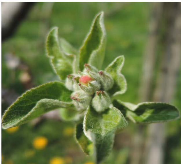
Melo, Gala , Sant'Antonino, 07.04 Stadio E, bottoni rosa