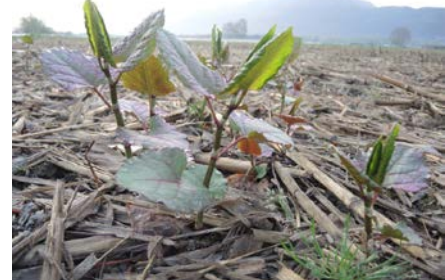
Germogli di poligono del Giappone

Lotta meccanica: lo sfalcio intensivo non permette di eliminare completamente un focolaio, ma ne diminuisce il vigore. Grazie a sei sfalci all'anno, dopo il primo anno la riduzione della biomassa è di oltre il 50%, dopo il quarto anno dell'80%. Il primo taglio va eseguito quando i fusti raggiungono il mezzo metro di altezza, indicativamente da aprile a ottobre, 1-2 volte al mese.